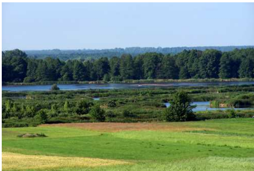
Rysunek nr 1. Rozlewiska rzeki Wieprz

Do osobliwości przyrody nieożywionej, atrakcyjnych dla turystyki krajoznawczej należy zaliczyć: malownicze, meandrujące koryto Wieprza (jego długość wynosi 18 km) i różnorodne formy wydymowe, niejednokrotnie o wysokich walorach dydaktycznych. Podstawowymi siedliskami decydującymi o charakterze fauny są siedliska leśne i zaroślowe na wysoczyźnie, siedliska polne, a także tereny osadnicze, z którymi są związane gatunki synantropijne. Najcenniejsze są siedliska wodno - błotne, łąkowe i łąkowe w dolinie Wieprza, gdzie gnieździ się wiele rzadkich gatunków ptaków. Najbardziej naturalny charakter zachowały zoocenozy w mało przekształconej dolinie Wieprza. Dotyczy to zwłaszcza ptaków wodnych, łąkowych i zaroślowych związanych z siedliskami pasa meandrowego rzeki, płazów, których miejscami rozrodu są zarastające starorzecza, a także fauny bezkręgowej (trzmieci i motyli), występującej na mało przekształconych i okresowo zalewanych łąkach. Bogata roślinność „Pradoliny Wieprza” stała się siedliskiem rzadkich gatunków ptaków m. in. perkozów, derkaczy, remizów, pustulek, łabędzi niemych, błotniaków, a także zwierząt: wydry, żółwia błotnego oraz bobrów.