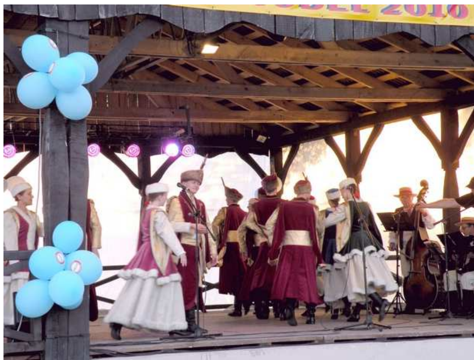
Rysunek nr 3. Międzynarodowy Festiwal Tańców GODEL 2010

Gminne Centrum Kultury organizuje szereg imprez i wydarzeń o charakterze kulturalno-społecznym: Międzynarodowy Festiwal Tańców GODEL, przegląd zespołów rockowych „Mocne Uderzenie”, Spotkanie opłatkowe dla osób samotnych i starszych, Zabawa z gliną - pokaz garncarski, Wieczór literacki, Gminny Przegląd Pieśni przedszkolnej, dziecięcej i młodzieżowej, Warsztaty plastyczne - wicie palm i robienie stroików wielkanocnych, Kiermasz świątecznej sztuki ludowej, Festyn z okazji 3-go maja, Cykl imprez z okazji obchodów Dnia Dziecka, Poznaj uroki okolicy w której mieszkasz - wakacyjne wycieczki rowerowe, Lato z Gminnym Centrum Kultury, koncerty, Zwiedzanie zabytków i miejsc upamiętniających wydarzenia historyczne na terenie gminy, Dożynki Gminne, Święto pieczonego ziemniaka, "Król grzybobrania", Gminne Obchody Święta Odzyskania Niepodległości, Warsztaty bożonarodzeniowe, Przegląd Kolęd i Pastorałek.