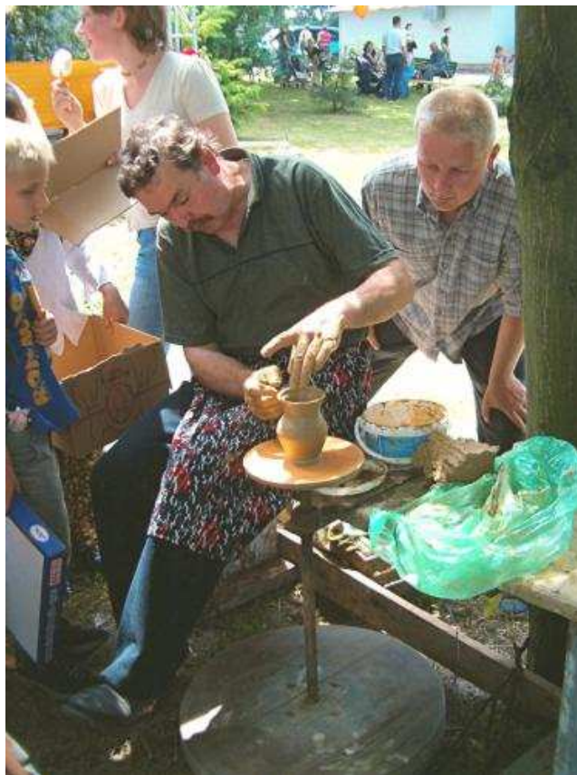
Rysunek nr 5. Pokaz garncarstwa w Baranowie