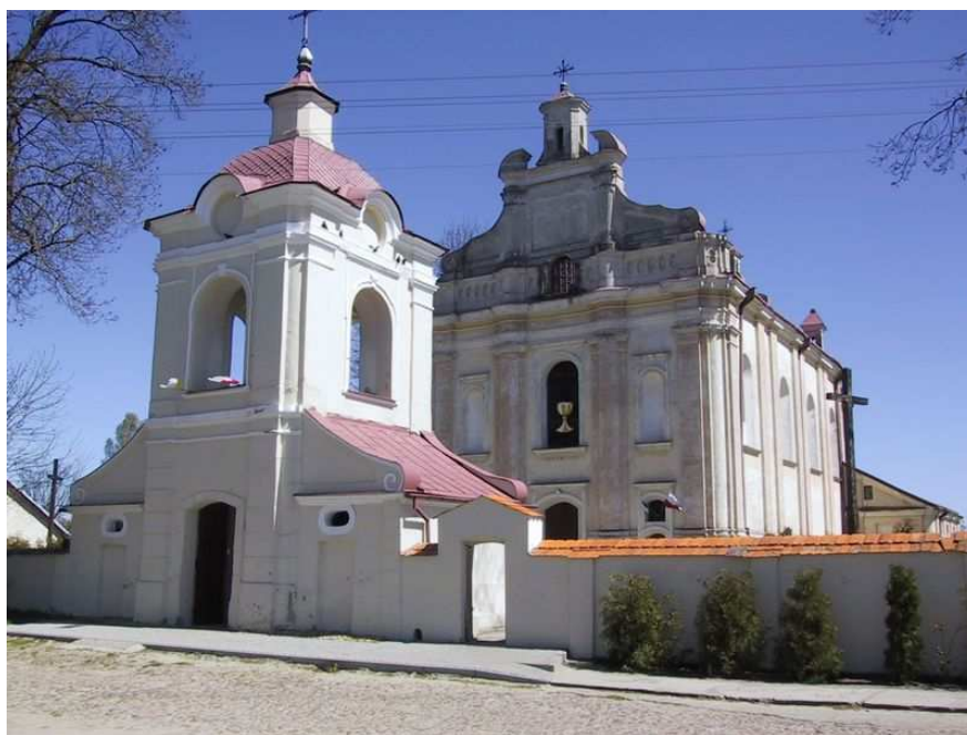
Rysunek nr 2. Kościół parafialny pod wezwaniem Świętego Jana Chrzciciela

Kościół parafialny pod wezwaniem Świętego Jana Chrzciciela został wybudowany w latach 1764-1781, konsekrowany w 1779 r przez biskupa Jana Lenczowskiego. Jest to budynek murowany z cegły, jednonawowy, późnobarokowy. Przy prezbiterium znajdują się dwie kaplice. Elewacja kościoła jest bogato modelowana, sklepienie półkoliste, wystrój wnętrza został zachowany z okresu budowy kościoła. W kościele znajduje się 7 ołtarzy barokowych. W ołtarzu głównym znajduje się obraz Matki Boskiej Częstochowskiej i na zasuwie obraz Świętego Jana Chrzciciela. W kościele znajduje się też barokowa ambona, drewniana chrzcielnica a na chórze muzycznym 10- głosowe organy z 1908 r. Dzwonnica została wybudowana wraz z kościołem. Znajdują się w niej dwa dzwony.