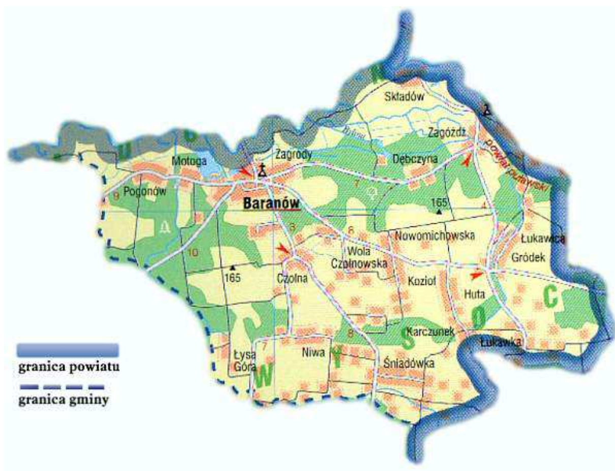
Mapa 1. Układ przestrzenny gminy Baranów i położenie miejscowości Pogonów

Miejscowość zamieszkuje 239 osób, w tym 130 kobiet i 109 mężczyzn. Pogonów jest położony w odległości 2 km od Baranowa (siedziba władz gminy), 20 km od Puław (siedziba władz powiatu) i 64 km od Lublina (siedziba władz województwa).