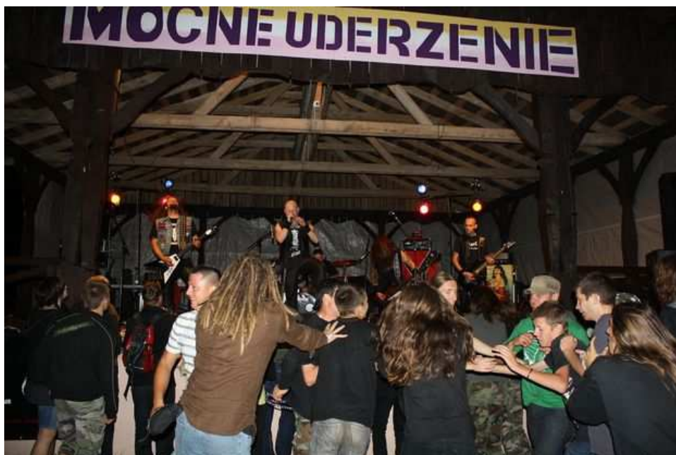
Rysunek nr 4. Przegląd Zespołów Rockowych Mocne Uderzenie II