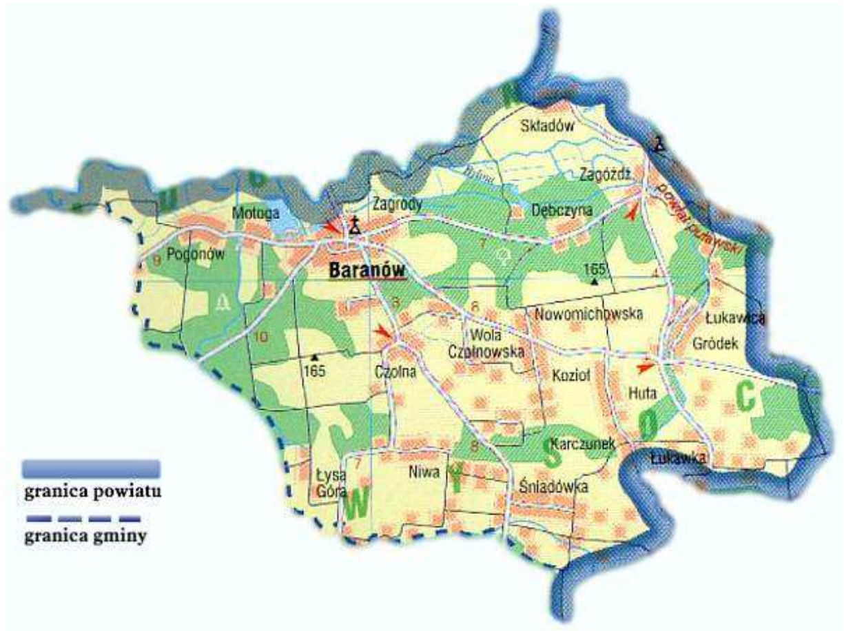
Mapa 1. Układ przestrzenny gminy

Powierzchnia Baranowa wynosi 28 km 2 , co stanowi 32 % całkowitej powierzchni gminy. Miejscowość zamieszkuje 1690 osób, co stanowi 39 % ludności gminy. W Baranowie mieści się siedziba władz gminy. Miejscowość jest położona w odległości 20 km od Puław (siedziba władz powiatu) i 65 km od Lublina (siedziba władz województwa).