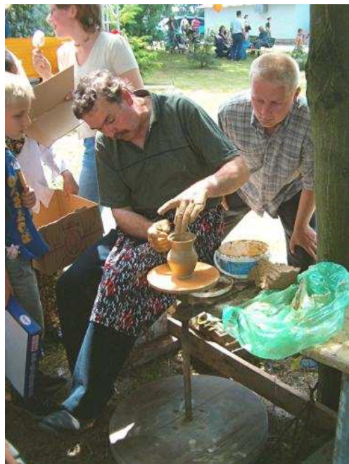
Rysunek nr 4. Pokaz garncarstwa w Baranowie