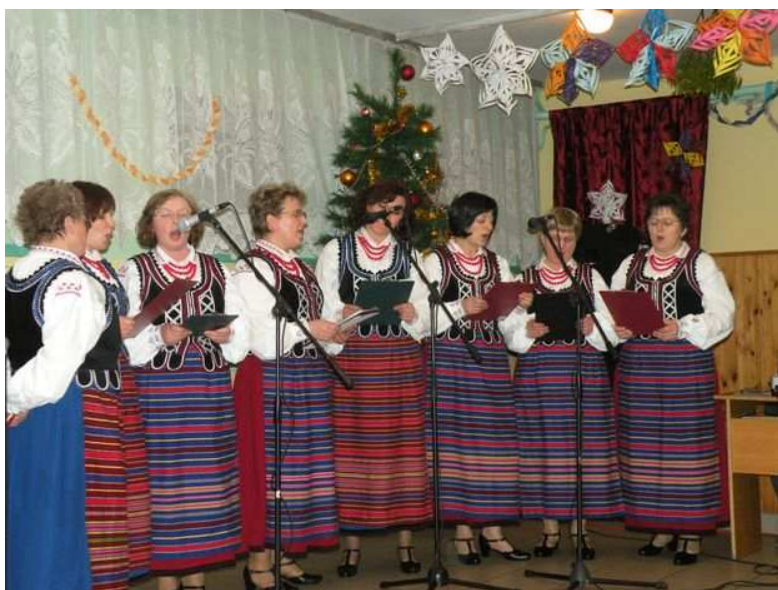
Rysunek nr 3. Przegląd kolęd i pastorałek z 2008 r.

Gminne Centrum Kultury organizuje szereg imprez i wydarzeń o charakterze kulturalno-społecznym: Spotkanie opłatkowe dla osób samotnych i starszych, Zabawa z gliną - pokaz garncarski, Wieczór literacki, Gminny Przegląd Pieśni przedszkolnej, dziecięcej i młodzieżowej, Warsztaty plastyczne - wicie palm i robienie stroików wielkanocnych, Kiermasz świątecznej sztuki ludowej, Festyn z okazji 3-go maja, Cykl imprez z okazji obchodów Dnia Dziecka, Poznaj uroki okolicy w której mieszkasz - wakacyjne wycieczki rowerowe, Lato z Gminnym Centrum Kultury, koncerty, Zwiedzanie zabytków i miejsc upamiętniających wydarzenia historyczne na terenie gminy, Dożynki Gminne, Święto pieczonego ziemniaka, "Król grzybobrania", Gminne Obchody Święta Odzyskania Niepodległości, Warsztaty bożonarodzeniowe, Przegląd Kolęd i Pastorałek.